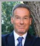
Sindaco ARCH. COMINATO MARCO

Ricevimento: su appuntamento allo 041 5137145 - segreteria@comune.fiessedartico.ve.it