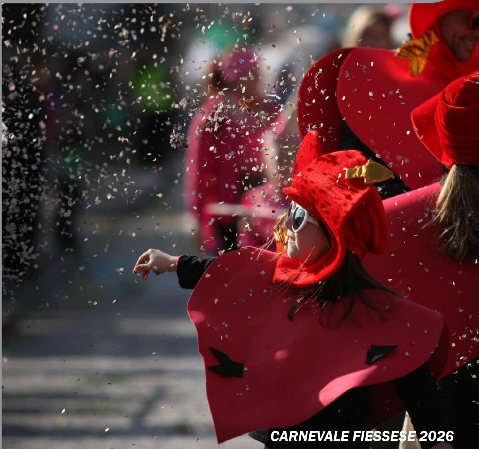
CARNEVALE FIESSESE 2026